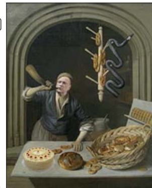
Der Bäcker stößt ins Horn, um 1681, Gemälde von J.A. Berckheyde